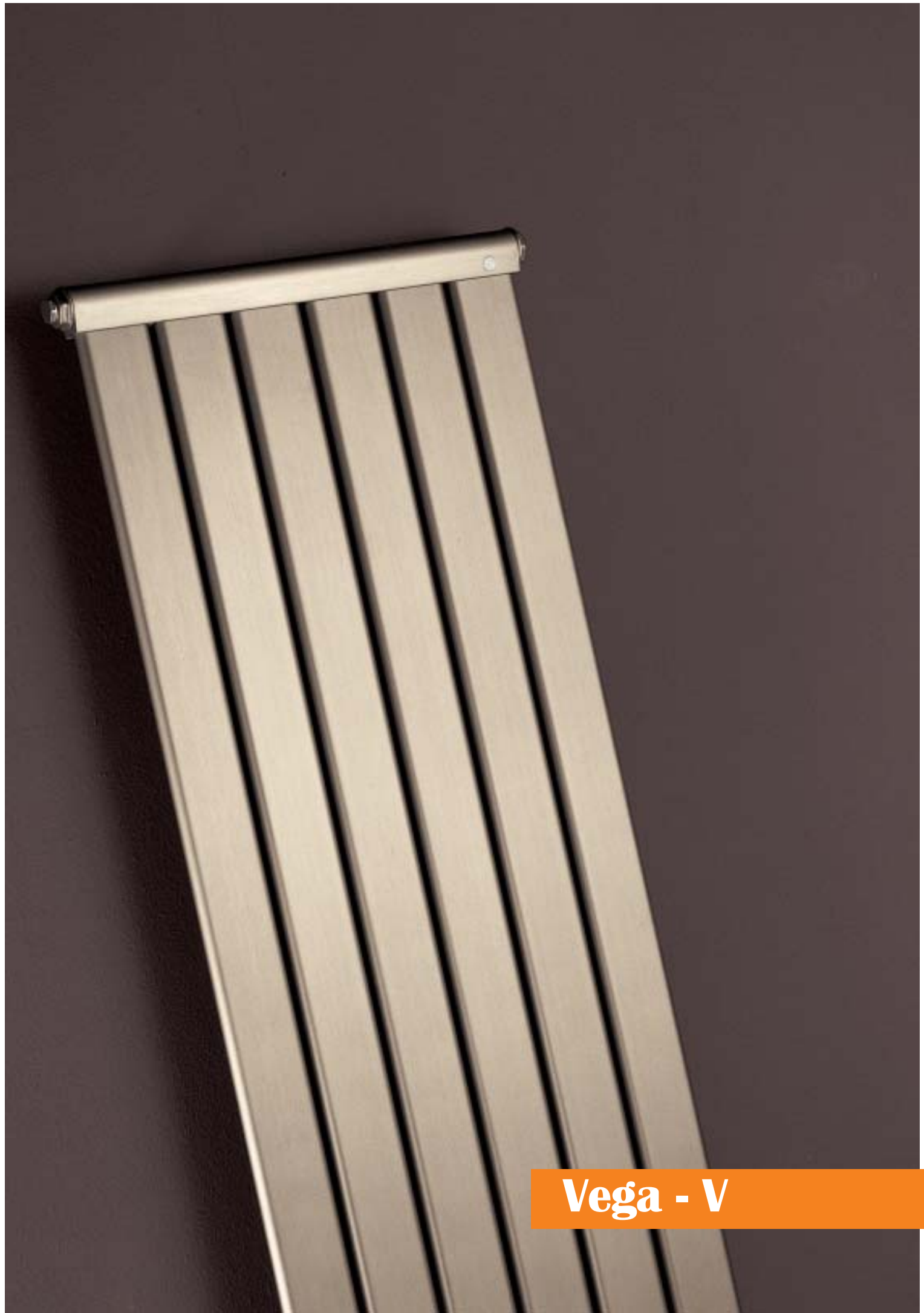
Vega - V